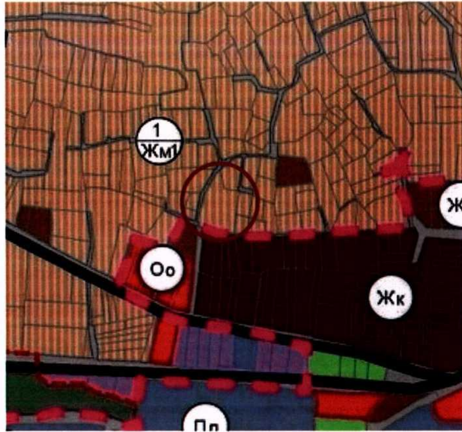
Извадка от ОУП Дряново