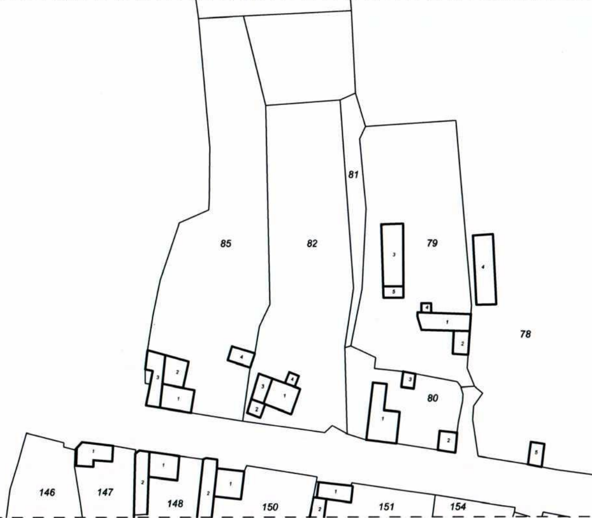
ИЗВАДКА ОТ ДЕЙСТВАЩАТА КАДАСТРАЛНА КАРТА с. Маноя, общ. Дряново М 1:1000